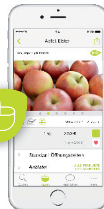
ONLINE KAUFEN *