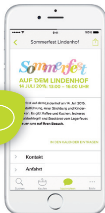
INTERAKTIV KOMMUNIZIEREN *